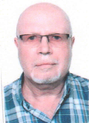
Фото делегованого представника

Офіційна сторінка у ФейсБук - https://www.facebook.com/People.Against.Corruption.2018/