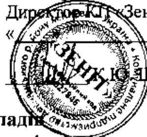
Схема посадових окладів